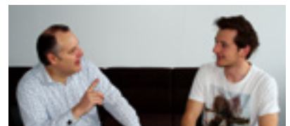
Das neue Mentoring-Konzept von Goethe-Unibator

Wir werden in der Forschung weitere Akzente setzen, insbesondere mit einer klaren Profilbildung gegenüber Berlin und Brüssel aufwarten. In Hessen weiß jeder, wofür wir stehen und in welchen Forschungsgebieten wir gut sind. Allein 40 % der Mittel aus der hessischen Landesexzellenzinitiative gehen an die Goethe-Universität; hier haben wir bereits einen Namen und stehen für Forschungsstärke. Ähnliches müssen wir auch in Berlin und Brüssel erreichen. Da gibt es, glaube ich, gute Möglichkeiten. Ich war vergangene Woche in Brüssel, da konnte ich an einige Kontakte aus meiner früheren Tätigkeit anknüpfen. Ich bin sowohl in Berlin als auch in Brüssel auf großes Interesse und Zutrauen in die Fähigkeiten der Wissenschaftler der Goethe-Universität gestoßen. Wir erhalten auch viel Unterstützung von der hessischen Landesvertretung. Jetzt planen wir einige Aktionen, um in nächster Zeit sichtbarer zu werden, eben um auch in Brüssel die Marke »Goethe-Universität« aufzubauen.