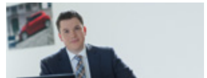
Alumni-Stimmen aus der Praxis