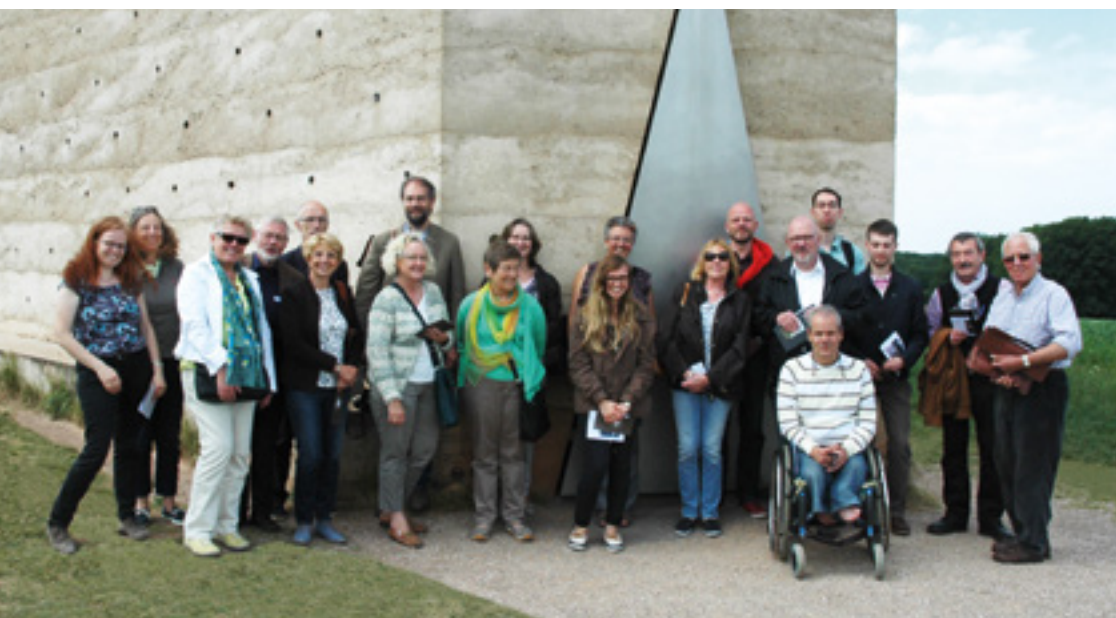
Mitglieder der GAFF während einer Tagesexkursion nach Mechernich-Wachendorf zur Feldkapelle im Sommer 2015

Der Mitgliedsbeitrag beträgt für Einzelpersonen 50 Euro, für Ehepaare 75 Euro und für Studierende 25 Euro pro Jahr. Firmenmitgliedschaften sind ebenfalls möglich, sie kosten 500 Euro pro Jahr. Weitere Informationen unter www.uni-frankfurt.de .