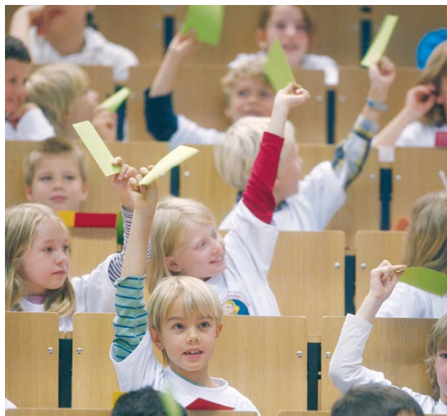
Gar nicht oberlehrerhaft geht es bei der Frankfurter Kinderuni zu.

Auf Schülerinnen und Schüler von acht bis zwölf Jahren wartet wieder ein spannendes Programm. Gemeinsam mit Wissenschaftlern der Goethe-Universität können sie bei 15