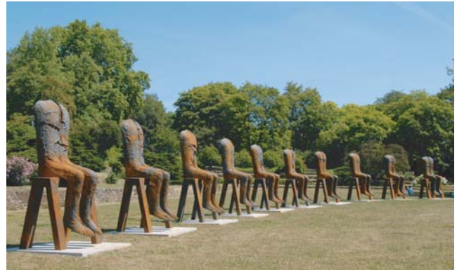
Kopflöse vor der Denkstätte. Die Großskulptur der Künstlerin Magdalena Abakanowicz zieht derzeit alle Blicke auf sich.