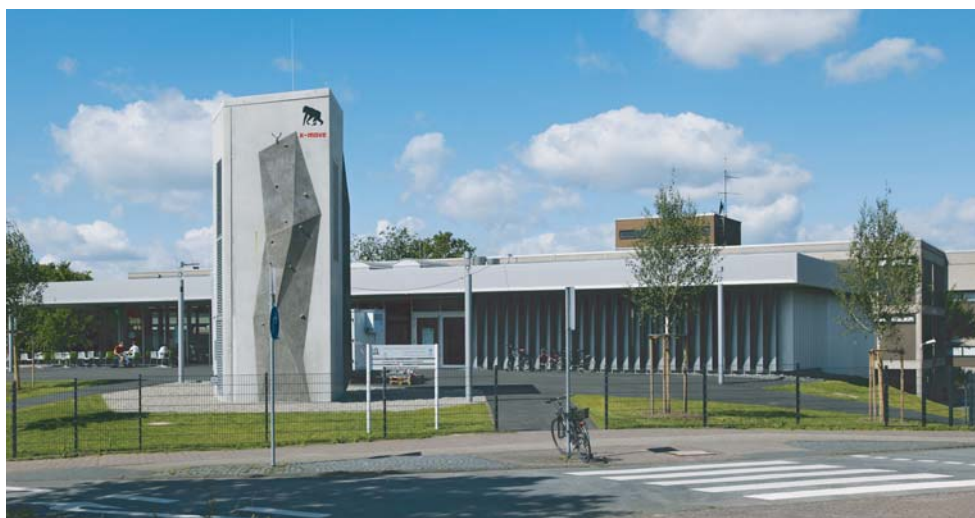
Der Kletterturm ist das neue, weithin sichtbare Wahrzeichen des Sportcampus.