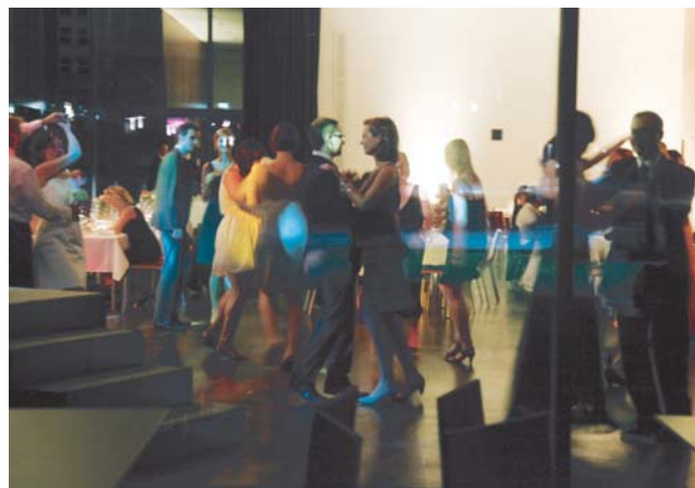
‚Dancing with the Stars‘ – beim Alumni-Sommerball treffen sich Absolventen, Ehemalige, Professoren, Mitarbeiter sowie das Präsidium der Goethe-Universität auf der Tanzfläche.

Samstag, 14. Juli 2012, 19 Uhr Campus Westend, Casino