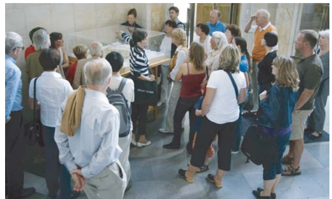
Die Goethe-Universität erlebt derzeit viele Veränderungen, so dass es stets Neues zu entdecken gibt.