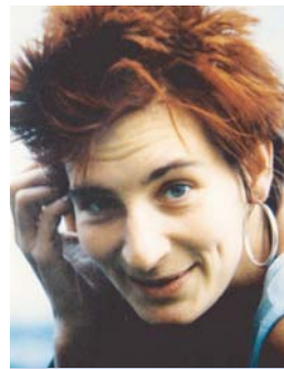
... sowie als Studentin in den 1980er Jahren

Ich wünsche mir für eine Universität der Zukunft, dass neben Fachwissen, e-Learning und was noch kommen mag, der Blick über den eigenen Tellerrand und ein menschliches Miteinander nicht verloren gehen.