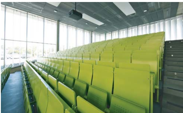
Grün ist die Spielwiese der Sportler – jetzt auch in Hörsaal und Cafeteria.