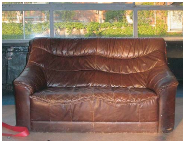
Nicht nur die legendäre Ledercouch aus dem alten KOMM wird überleben. Auch der Flipperautomat und die Discokugel werden im neuen Haus eine Erinnerung an das alte ‚Feeling‘ aufkommen lassen.

spannung. Umgeben ist das zwischen Apotheke und Spielplatz gelegene Gebäude von altem Baumbestand.