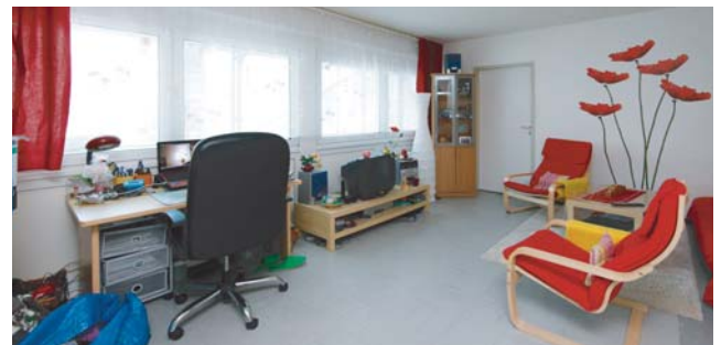
Tausende von Studierenden haben hier bereits gewohnt. Das Wohnheim ‚Ginnheimer Landstraße‘ wurde komplett saniert (Foto links) und neu eingerichtet.

An der Hansaallee entsteht derzeit ein Wohnheim mit 400 Zimmern, das zum Wintersemester 2014 bezugsfertig sein soll. Doch das reicht nicht. „Wir brauchen viel mehr.“ Vor allem, da im kommenden Jahr noch mehr doppelte Abiturjahrgänge an die Hochschulen strömen. Doch in Frankfurt gibt es wenig freie Flächen zum Bauen. Und Bauen ist teuer. Auch private Investoren setzen inzwischen auf Studenten. „Die meisten