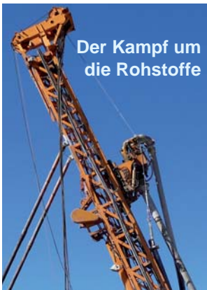
Der Kampf um die Rohstoffe