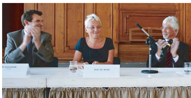
Die frisch gewählte Vizepräsidentin Brühl will auch Akademiker zurück an die Uni locken.

Lehre. „Das wird mir viel Spaß machen. Die forschungsorientierte Lehre ist im Tagesgeschäft untergegangen.“ Auch lebenslanges Lernen steht auf ihrer Agenda. Ihre Vision: 2020 sollen auch berufstätige Akademiker zu Fortbildungen an die Goethe-Universität kommen. „Wir müssen erst einmal