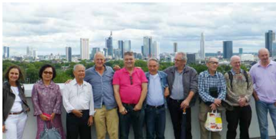
Wiedervereint auf dem Dach des Wohnheims