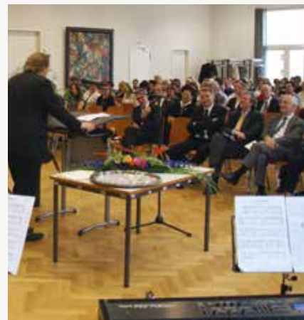
Alljährlicher Höhepunkt ist die Absolventenverabschiedung des Historischen Seminars.

MEHR ZUR TÄTIGKEIT DES VEREINS UNTER: www.historiae-faveo.de/