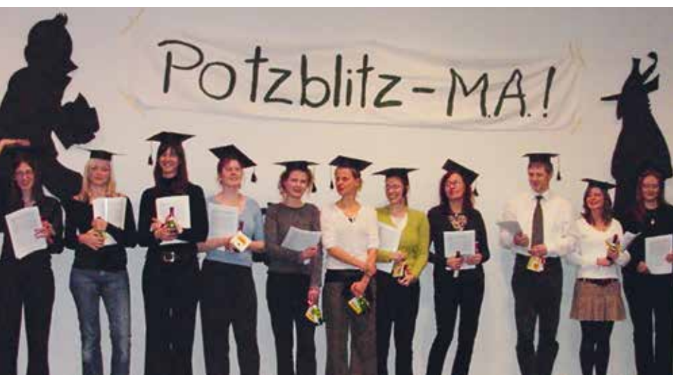
Examensfest der Magister-Studierenden 2005

Der Jahresbeitrag beträgt 15,- Euro für Studierende, 45,- Euro für andere Personen und 135,- Euro für korporative Mitglieder. Vereinsmitglieder erhalten die »Jahresgabe« ebenso wie die Zeitschrift »Kinder- und Jugendliteraturforschung Frankfurt« kostenlos.