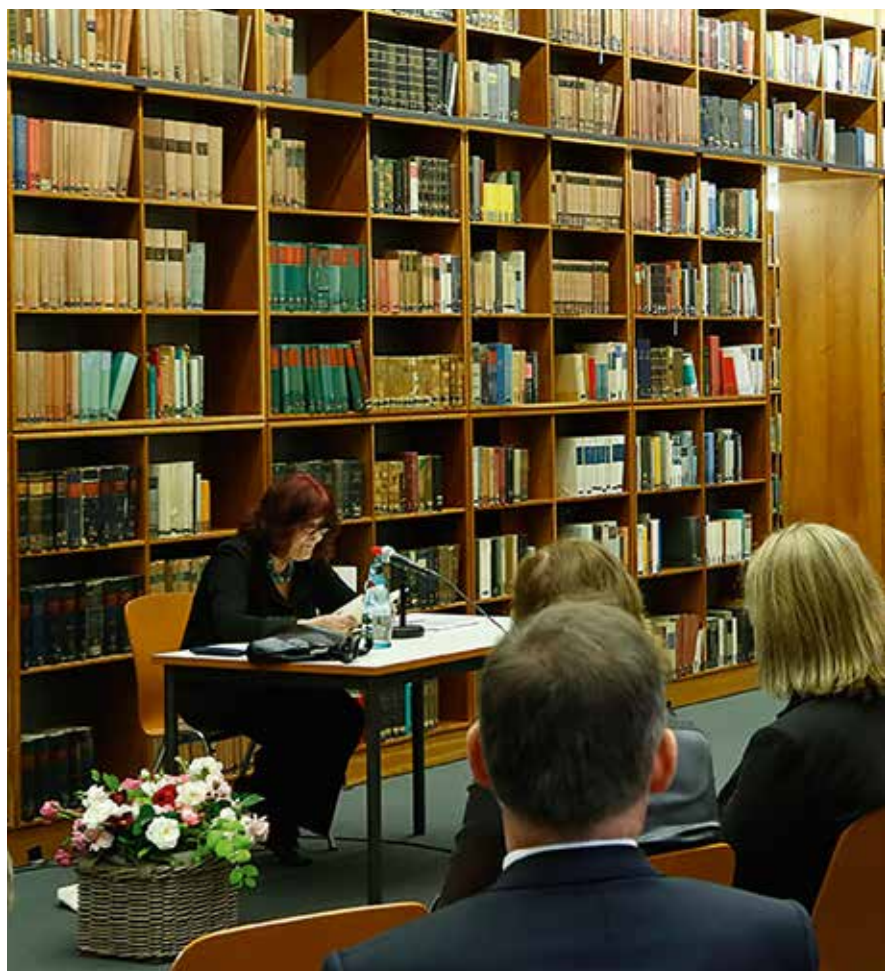
Eva Demski im Historischen Lesesaal im I.G.-Farben-Haus